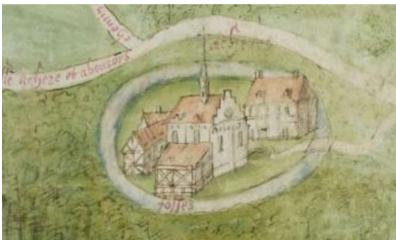
Le prieuré d'Achères entouré d'un fossé