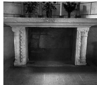
L'autel avec ses ornements géométriques