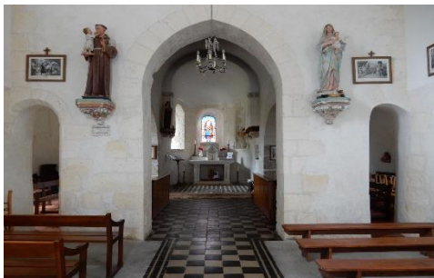
Les étroits passages Berrichons

Comme les années précédentes, les reproductions du plan de la Terre et Franchise d'Achères au XVI siècle et de la carte de Cassini du XVIII siècle représentant la Principauté de Boisbelle ont attiré la curiosité des visiteurs notamment les nouveaux habitants de notre commune.