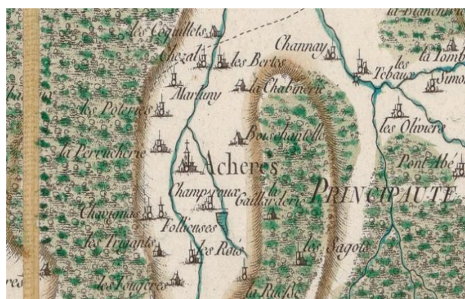
La Contrée d'Achères dans la Principauté de Boisbelle