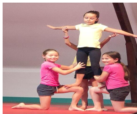
La classe de CE2-CM1-CM2 d'Achères

Nous vous donnons rendez-vous l'année prochaine pour de nouvelles aventures !