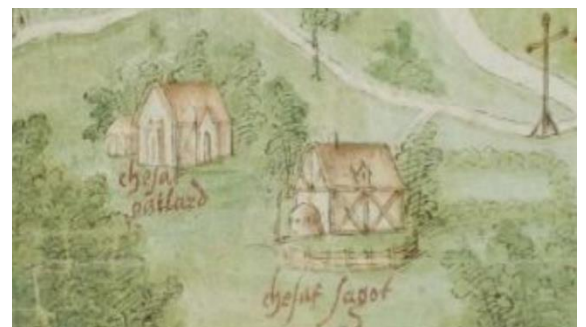
Les chesaux Gaillard et Sagot avec la croix de chemin